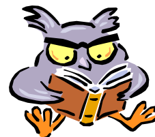
Podpis do obrazu/

Autorki :Natalia Gregarek i Karolina Korze- niec